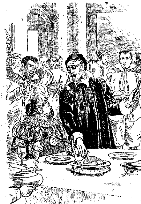
«Σταθίτε! ἀνέκραξεν ὁ ἰατρός...» (Σελ. 270, στ. γ')

α) Ἄλλα τὰ μάτια τοῦ λαγοῦ κ' ἄλλα τῆς κουκουβάχιας.—β) Δωδώνη, Μέσσοβον, Πρέβεζα, Τεπελιώνιον, Πρεμέτι, Λάμπουον.