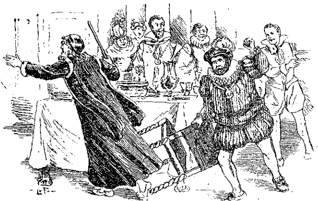
«Ὁ ἰατρός ἐτρέπη εἰς φυγὴν.» (Σελ. 271, στ. α')

Τὴν ἄλλην ἡμέραν, ἀφοῦ τὸν ἔκαμαν πάλιν νὰ ὑποσχεθῇ ὅτι δὲν θὰ ἐλησημονεῖ τὴν ποινὴν του, ὁ Σάντος ἀνεχώρησε διὰ τὴν νῆσον του, συνοδευόμενος ὑπὸ τοῦ οἰκονόμου τοῦ δουκός, ἀνθρώπου συνετοῦ καὶ συγχρόνως φίλου